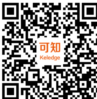
可知移动端 APP 二维码