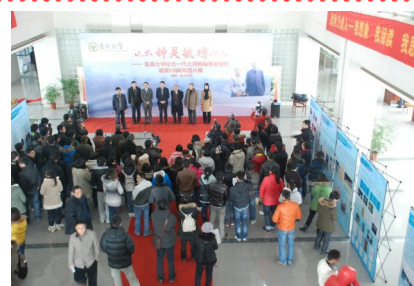
← 钟灵毓秀——顾毓琇老校长诞辰110周年图片展在图书馆展出

此次培训得到了馆内各部门人员和研究生的积极参与，大家普遍反映通过培训开阔了眼界、拓展了思维，培训中介绍的方法和技巧也可以应用到日常工作中，并希望结合查新报告实例，为学员们分析查新过程中可能遇到的问题及解决方法；朱佳鸣老师介绍了生物医药科技查新的特点和重点，为大家普遍反映通过培训开阔了眼界、拓展了思维，培训中介绍的方法和技巧也可以应用到日常工作中，并希望结合查新报告实例，为学员们分析查新过程中可能遇到的问题及解决方法；朱佳鸣老师介绍了生物医药科技查新的特点和重点，助力青年馆员更好的成长。(办公室供稿)