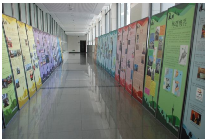
← “漫游澳门街，细说澳门情”——澳门图片展走进东南大学图书馆